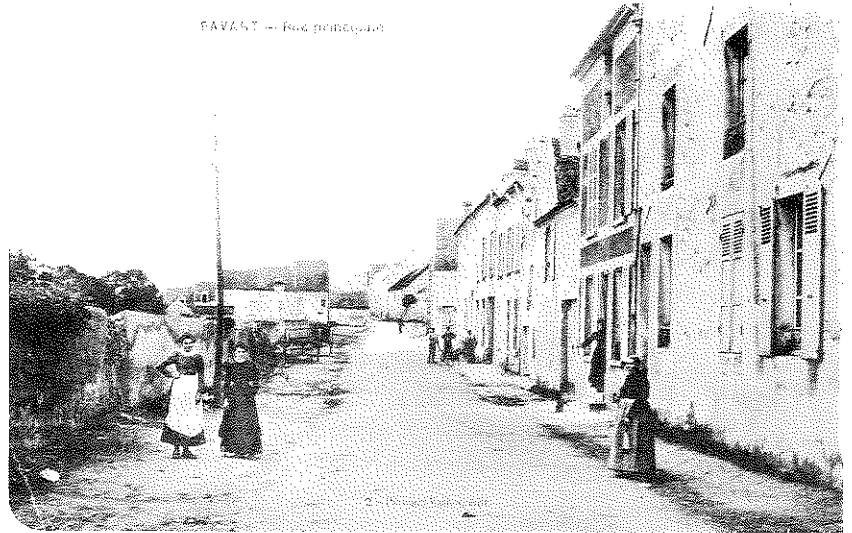
Rue la Fontaine dans le temps...